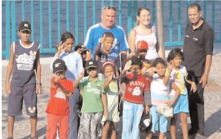
La vacanza 2006